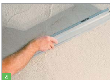
4 Glätten mit der Putzschiene