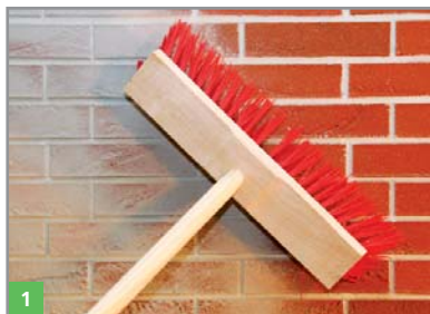
1 Vorbereitung des Untergrundes

Das Feuchteregulierungs-Putz-System BOTAZIT® RENOVATION kann direkt auf feuchtem Mauerwerk aufgetragen werden.