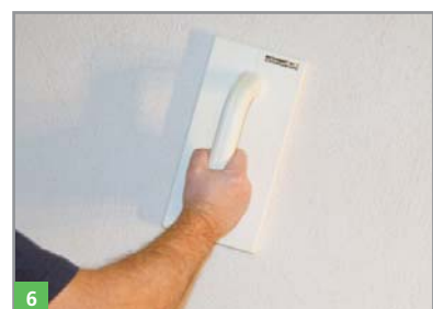
6 Glätten des Feinputzes BOTAZIT® RENOVATION FP