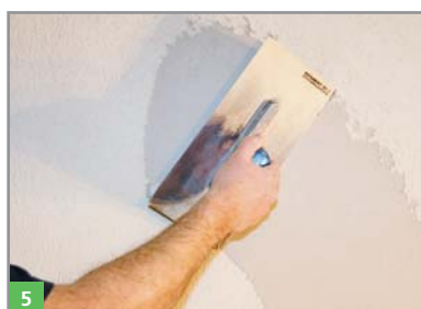
5 Optional Aufbringen des Feinputzes BOTAZIT® RENOVATION FP