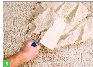
3 Aufbringen des Feuchteregulierungsputzes BOTAZIT® RENOVATION FRP