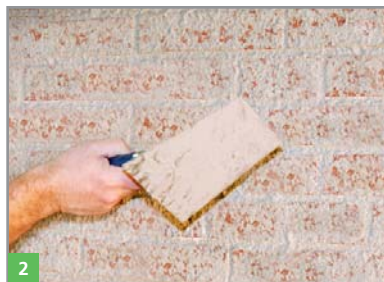
2 Netzförmiges Auftragen des Vorspritzmörtels BOTAZIT® RENOVATION VSM in Form eines Spritzbewurfs